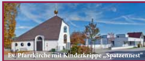
Ev. Pfarrkirche mit Kinderkrippe „Spatzennest“