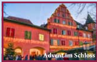
Advent im Schloss