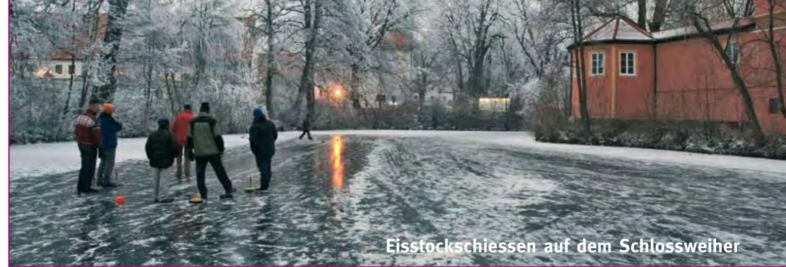
Eisstockschiessen auf dem Schlossweiher