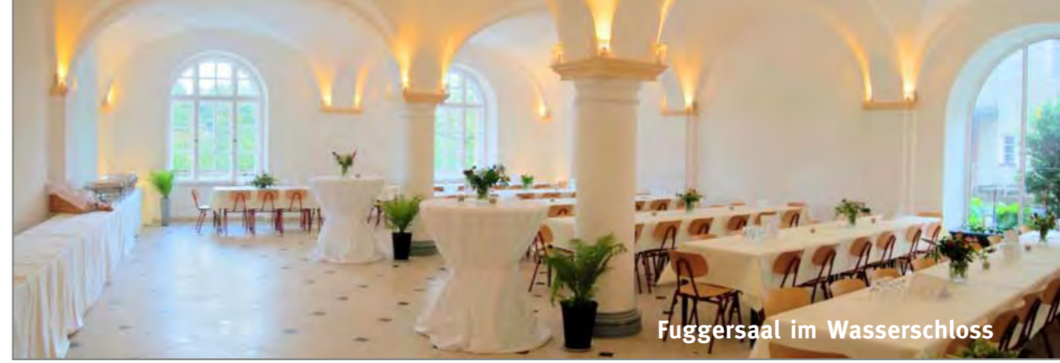
Fuggersaal im Wasserschloss