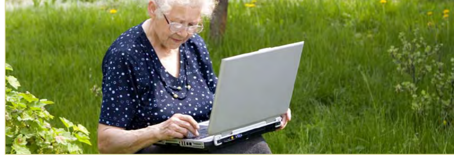
Pflege und Betreuung