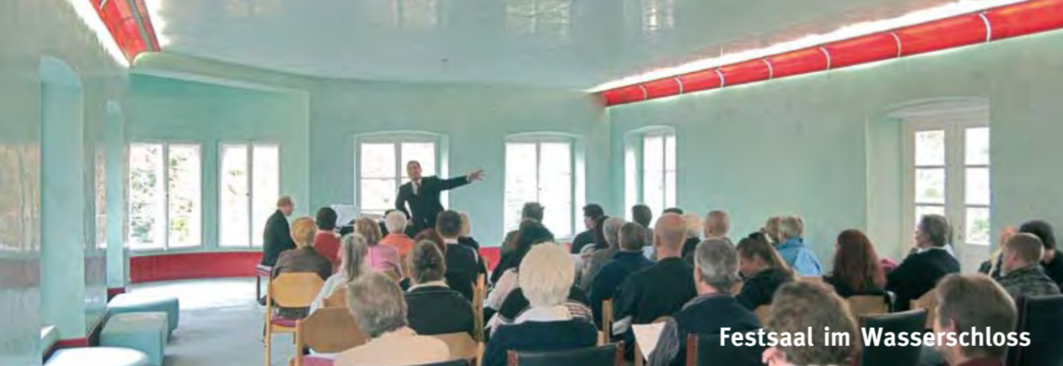
Festsaal im Wasserschloss