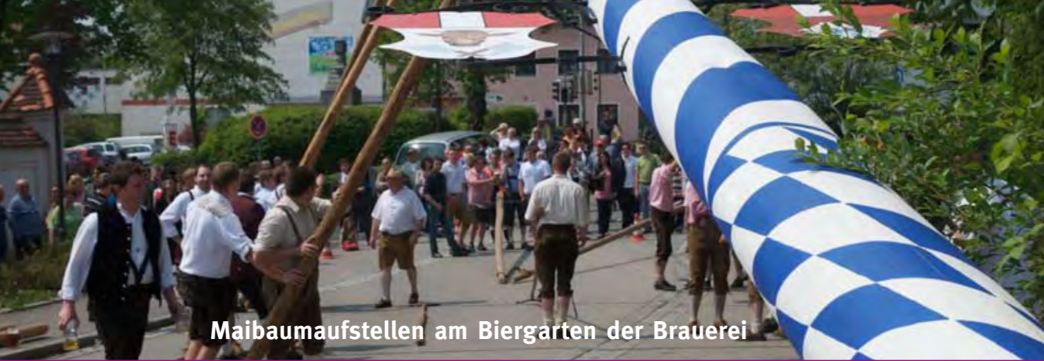
Maibaumaufstellen am Biergarten der Brauerei