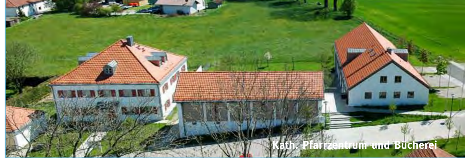
Kath. Pfarrzentrum und Bücherei