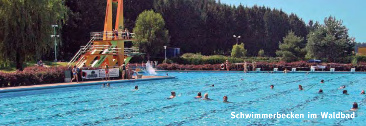
Schwimmerbecken im Waldbad