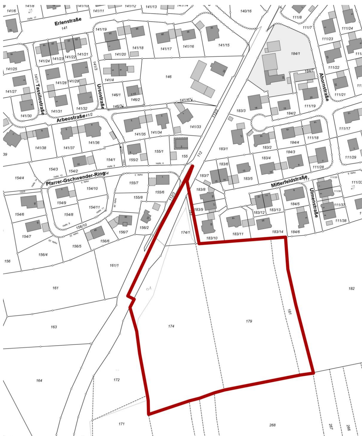
Lageplan mit Bebauungsplan-Umgriff, ohne Maßstab

Allerdings müssen hier, wie auch im gesamten Baugebiet, die Abstandsflächenregelungen der Bayerischen Bauordnung (BayBO) eingehalten werden, um nachbarschaftliche Interessen zu schützen und Konflikte vorzubeugen.