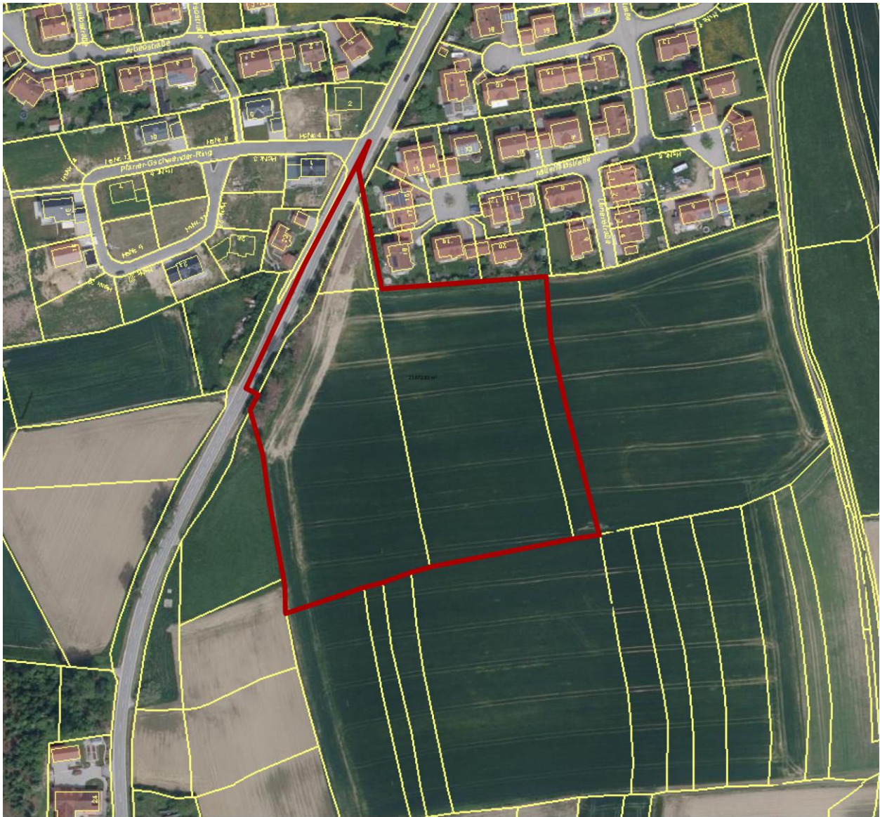
Luftbild mit dargestelltem Umgriff, ohne Maßstab